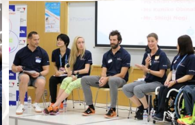
④スポーツのフェアとは？ユースアスリートへのメッセージ