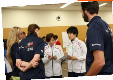
①英語/日本語で自己紹介

国内トップユースアスリート(12-25歳、17スポーツ)がリーダーアスリートと共に「New MO!」を通して新しいスポーツを創り、未来のリーダー、未来のスポーツに向けてのメッセージを発信