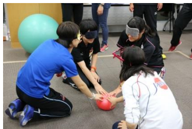
③各グループのテーマに沿って誰もが楽しくフェアに参加できるスポーツのルールをグループで創る