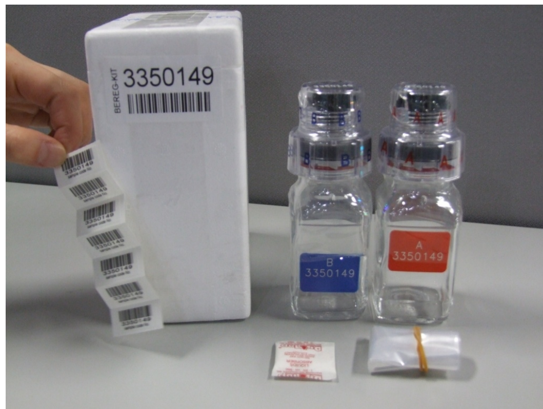
検査キット (A&Bボトル)